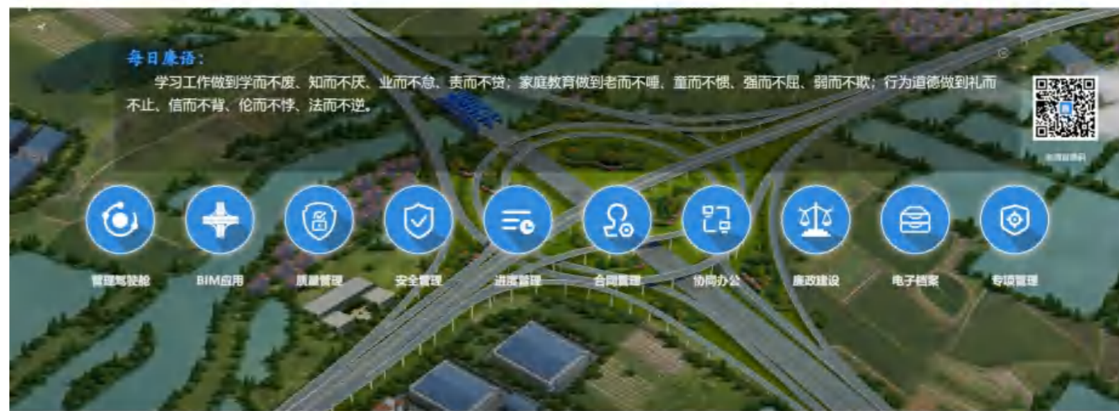
柯诸高速 KEZHU EXPRESSWAY